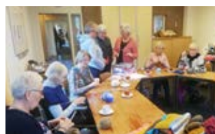
BUURTKERK / PAG 3