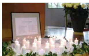
BEZINNING EN BEZIELING / PAG 4