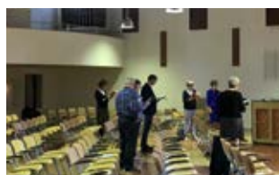
VIEREN IN DE FONTEIN / PAG 2