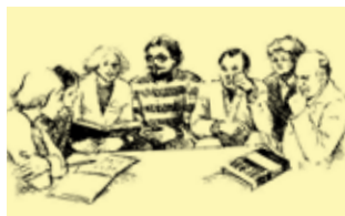
BEZINNING EN BEZIELING / PAG 4