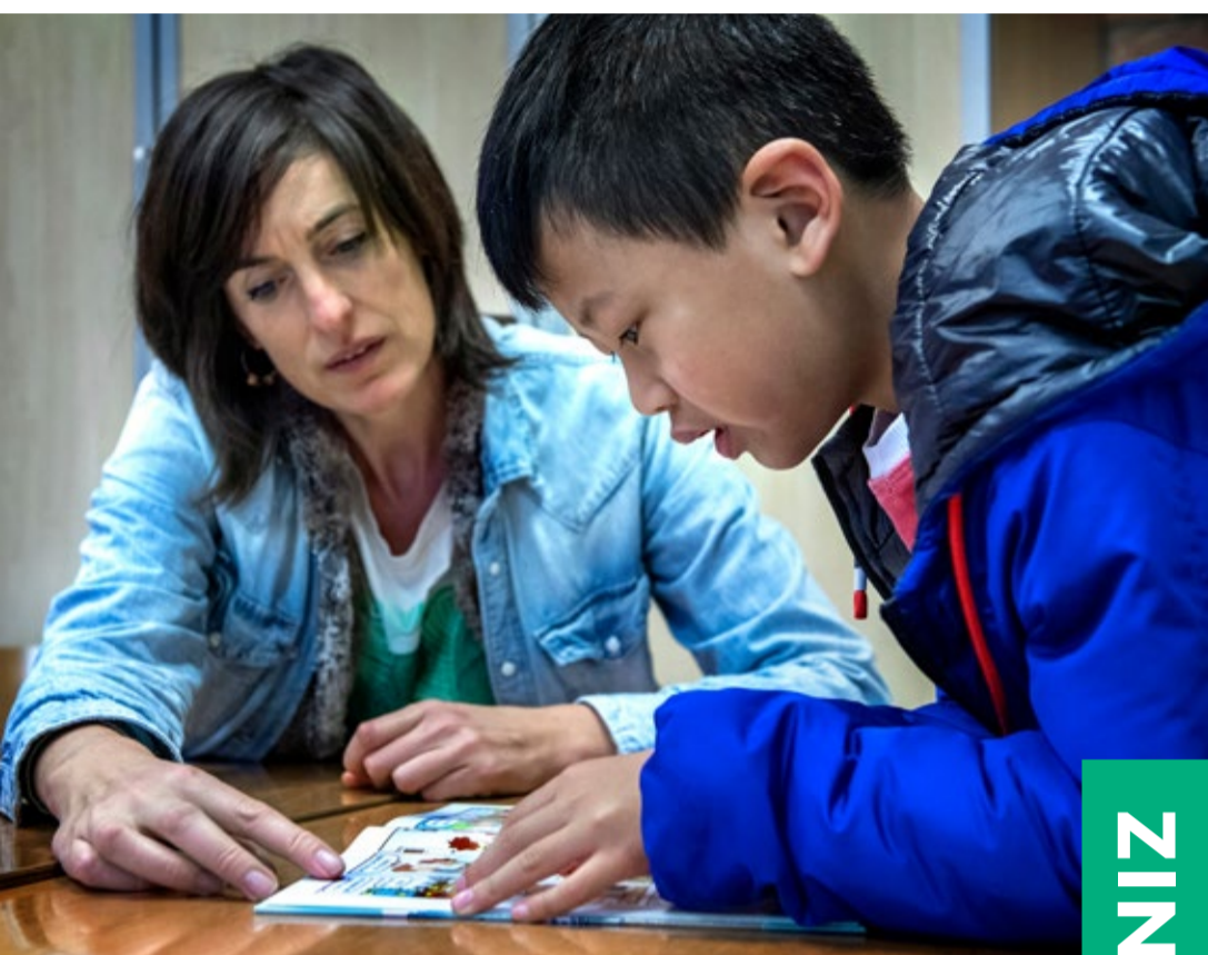
Activiteit van Together Groningen in de Fontein (zie pag. 3)

De Fontein kent een nauw samenwerkingsverband met de wijkgemeenten van De Bron en de Nieuwe Kerk. Alle drie horen zij bij de Protestantse Gemeente te Groningen.