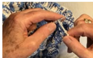
BUURTKERK / PAG 3