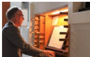
VIEREN IN DE FONTEIN / PAG 2