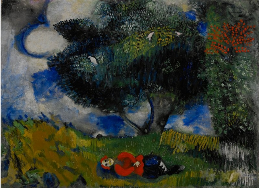
The Poet with the Birds (Marc Chagall 1911)

'Mijn juk is zacht en mijn last is licht'